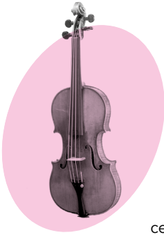
Violon, dit le « Davidoff », Antonio Stradivari, 1708, Italie, Musée de la musique – Philharmonie de Paris.

Le violon appartient à la famille des cordes frottées. Il est posé sur l'épaule. On en joue généralement en frottant ses quatre cordes avec un archet, une baguette de bois munie d'une mèche en crin de cheval. On peut aussi pincer les cordes avec les doigts, on joue alors en pizzicato . En effleurant les cordes à certains endroits, le son produit change de timbre, devient flûté : ce sont les harmoniques. Le premier violon a été inventé en Italie au début du xvi e siècle. De célèbres luthiers de l'époque l'ont perfectionné : Andrea Amati, puis Antonio Stradivari et Andrea Guarneri. Au début, c'est un instrument de rue, populaire. Par la suite, il s'impose dans la musique savante. Au xix e siècle, les bourgeois étudient le violon (tout comme le piano) pour se divertir. Les compositeurs écrivent leurs plus belles pages pour cet instrument dont le jeu est devenu très virtuose. Au xx e siècle, la facture évolue à nouveau avec l'invention des violons électriques.